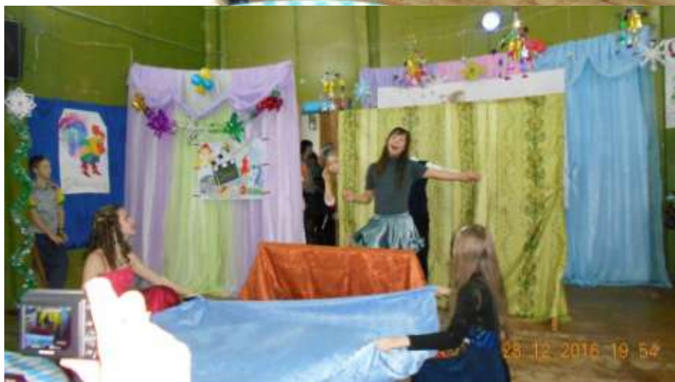
Новый год в начальной школе 28.12.2016